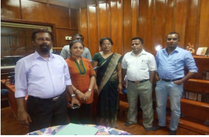
“Krushu Fm” இன் “சன்கதன” நிகழ்ச்சியில் பங்குகொள்ளல்.