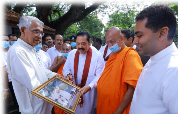
අගමැතිතුමාට සමරු කිළිණයක් පිළිගන්වමින්

කෘෂිකර්ම හා ග්‍රාමීය සංවර්ධන ක්ෂේත්‍රයේ උන්නතිය වෙනුවෙන් හෙක්ටර් කොබ්බෑකඩුව මැතිතුමා ඉටු කළ අනුපමේය සේවය සහ ඉඩම් ජනසතු කිරීම වෙනුවෙන් සිදු කළ මෙහෙවර මෙහි දී කෘතවේදීව සිහිපත් කරන ලදී. මෙරට ගොවිකටයුතු පර්යේෂණ ක්ෂේත්‍රයට මහත් දායකත්වයක් ලබා දෙමින් එතුමාගේ මෙහෙවරෙහි ගොවිකටයුතු පර්යේෂණ හා පුහුණු කිරීමේ ආයතනය ස්ථාපිත කිරීම කැපී පෙනේ. එම උත්සවයේ අවස්ථා ඡායාරූපවලින් දැක් වේ.