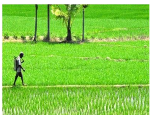
වී වගාව සංවර්ධනය සඳහා ගනු ලැබූ රාජ්‍ය ප්‍රතිපත්තිවල බලපෑම හත්කේරු කිරීම පිටුව 5