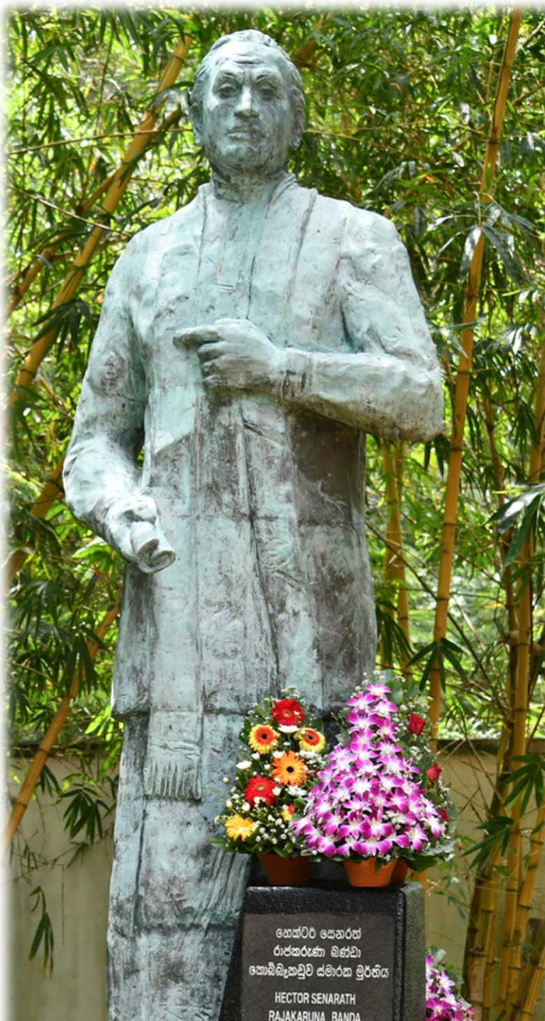
හෙක්ටර් කොබ්බෑකඩුව මහතාගේ ස්මාරකය