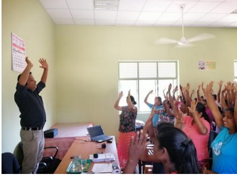
කෘෂි ව්‍යවසායිකාවන් බලගන්වන ගොවිකාන්තා සවිබල ගැන්වීමේ පුහුණු වැඩසටහන - පිටුව -7

වෙබ් 44 තෙවන හා සිවුවන කලාපය ISSN 1991 - 040X