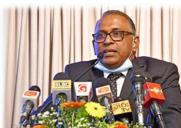
අධ්‍යක්ෂතුමා සභාව අමතමින්