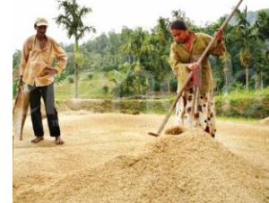
වී අලෙවිකරණයේ දී පුද්ගලික හා රාජ්‍ය අංශ වෙත සම්බන්ධ වන ගොවීන්ගේ සමාජ ආර්ථික හත්තවය පිටුව 4