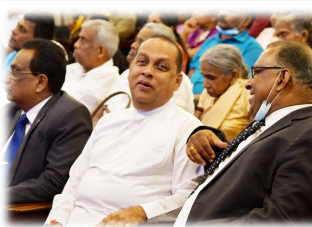
ගුණ සමරු වැඩසටහනට සහභාගී වූ පිරිස