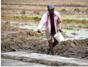
අනුරාධපුර දිස්ත්‍රික්කයේ වී නිෂපාදනය සඳහා වැඩි දියුණු කරන ලද කෘෂිකාර්මික ව්‍යාපති කේවාලි බලපෑම පිටුව 3