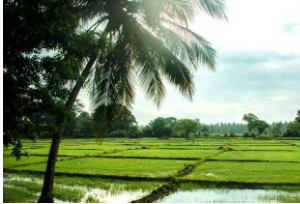
පහතරට හෙත් කලාපීය වෙරළබඩ දිස්ත්‍රික්කවල කුඹුරු ඉඩම් හිවු ලෙස භාවිතා කිරීමේ උපාය මාර්ග පිටුව 6