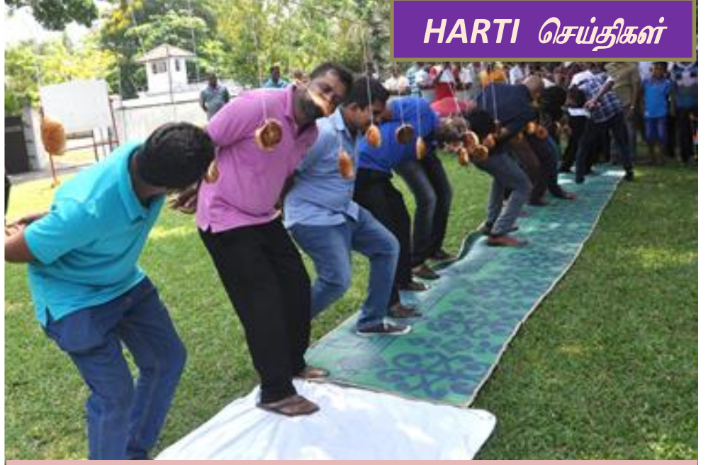
புதுவருட விளையாட்டுப் போட்டிகள் - 2017

ஹெக்டர் கொப்பேகடுவ கமநல ஆராய்ச்சிப் பயிற்சி நிறுவக நலன்புரி சங்கத்தினால் ஒழுங்குச்செய்யப்பட்ட தமிழ் சிங்கள புதுவருட கொண்டாட்டம் 2017 ஏப்ரல் 25ம் திகதி நிறுவன வளாகத்தில் நடைபெற்றது. இந் நிகழ்வில் கல்விசார், மற்றும் கல்விசாரா ஊழியர்கள் மற்றும் அவர்களது குடும்ப உறுப்பினர்கள் பங்குபற்றினார்கள். பாரம்பரிய புத்தாண்டு விளையாட்டு போட்டி நிகழ்வுகள் பல நடைபெற்றன. இப் போட்டிகளில் பலரும் ஆர்வத்துடன் பங்குபற்றியதைக் காணக்கூடியதாக இருந்தது. இந் நிகழ்வு பரிசளிப்பு வைபவத்துடன் இனிதே நிறைவுபெற்றது.